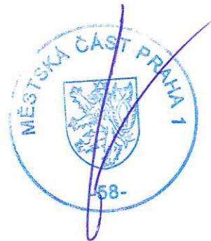
Bc. Ludvík Czital vedoucí odboru dopravy

Opatření obecné povahy nabývá účinnosti ve lhůtě stanovené zákonem č. 361/2000 Sb., zákon o provozu na pozemních komunikacích. Ve smyslu ust. § 173 odst. 2 zákona č. 500/2004 Sb., správní řád, proti opatření obecné povahy nelze podat řádný opravný prostředek. Ve smyslu ustanovení § 101 a násl. soudního řádu správního je možný přezkum u soudu.