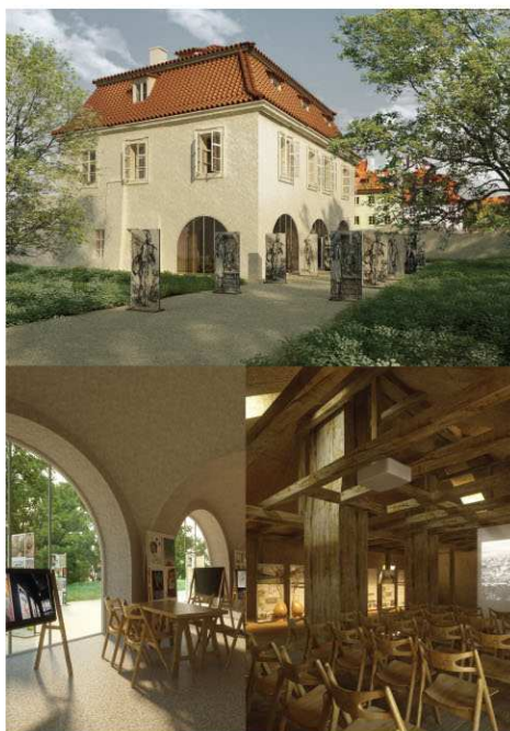
WERICHOVA VILA / ČELNÍ POHLED SCHEMA ROZMÍSTĚNÍ JEDNOTLIVÝCH AKTIVIT

Nadace hodlá klást důraz na celou škálu lektorských programů, které budou zacílené především na práci s mladými lidmi a tím přispějí k výchově nové generace kulturně zainteresovaných a vzdělaných lidí. Kromě školní mládeže a studentů nechce nadace v kulturním centru Jana Wericha a Jiřího Voskovce zapomenout ani na nejmenší návštěvníky z řad předškolních dětí a na rodiny s dětmi, pro něž bude připraven prostor k pravidelnému setkávání a aktivitám.