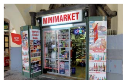
Víme o nich! Nevzhledné obchody hyzdí centrum města.

účinně prezentovat svoji provozovnu a její služby a sortiment.