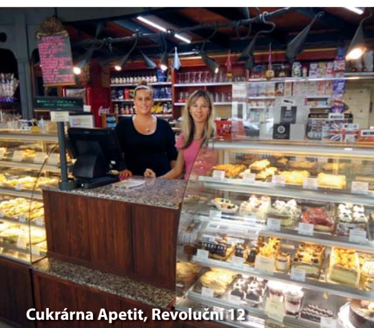
Cukrárna Apetit, Revoluční 12