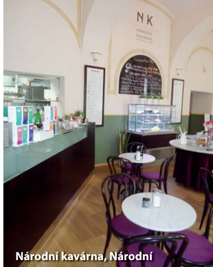
Národní kavárna, Národní