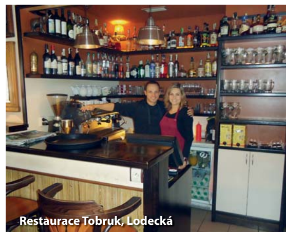
Restaurace Tobruk, Lodecká