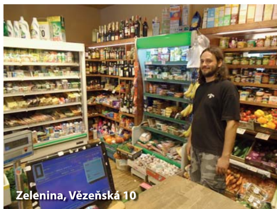
Zelenina, Vězeňská 10