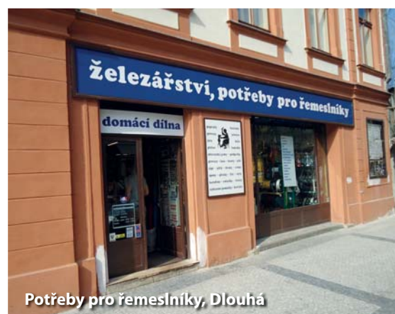
Potřeby pro řemeslníky, Dlouhá