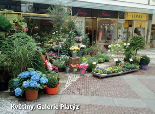
Květiny, Galerie Platýz