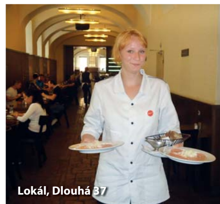
Lokál, Dlouhá 37