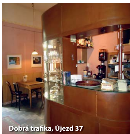
Dobrá trafika, Újezd 37