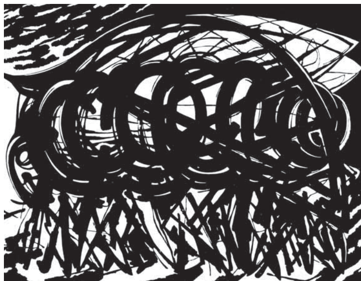
V běhu, dřevořez, 1988