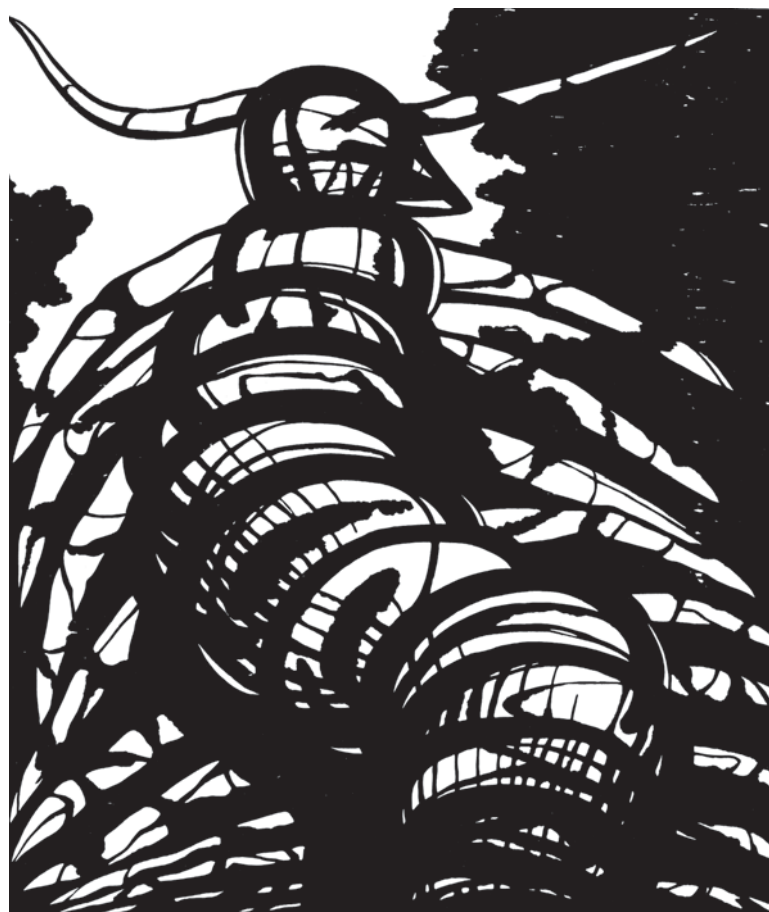
Stonožka , dřevořez, 1987