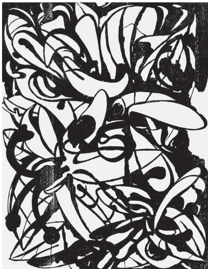
Květy , dřevořez, 1987