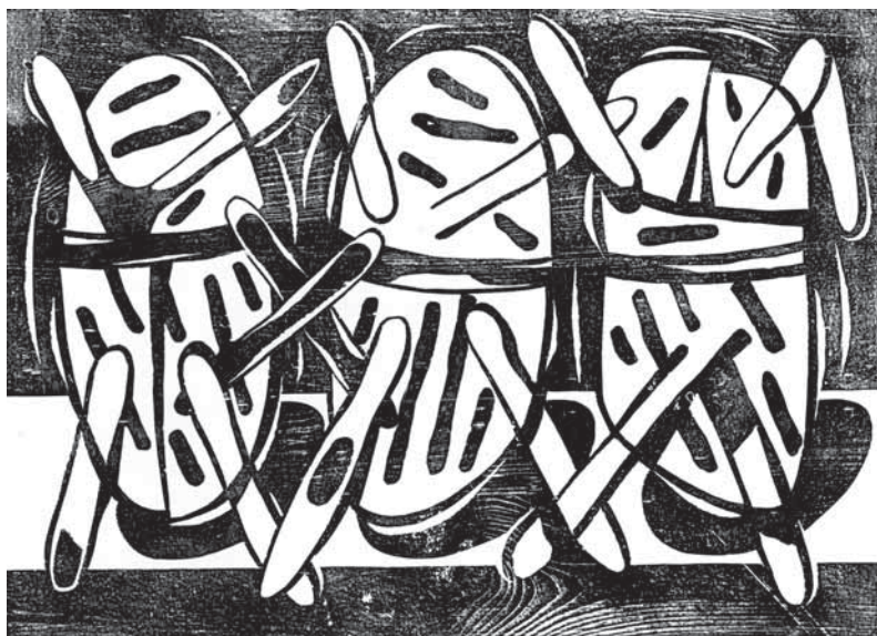
Tři, dřevořez, 1987