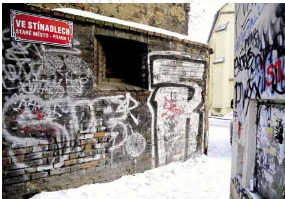
Sprejeři jsou schopni opravdu ledasčeho...

„Tento program spouštíme společně s granty na opravu domovního fondu, aby radnice efektivně využila prostředky, které určila na opravu fasád. Program radnice se týká nejen domů v majetku městské části, ale také těch, které se úspěšně zúčastnily výše uvedeného grantového programu. Nabízíme zdarma možnost pořízení speciálního ochranného nátěru fasády včetně následné péče o ni, čímž budeme bojovat proti jejímu poškozování. Fasáda však předtím musí být opravena a důkladně očištěna, aby na ni nátěr mohl být nanesen,“ vysvětluje zástupce starosty Prahy 1