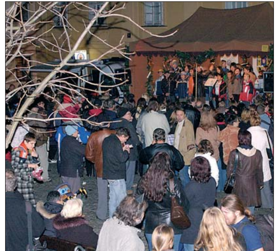
■ Rozsvícení vánočního stromu na Kampě přilákalo mnoho diváků.