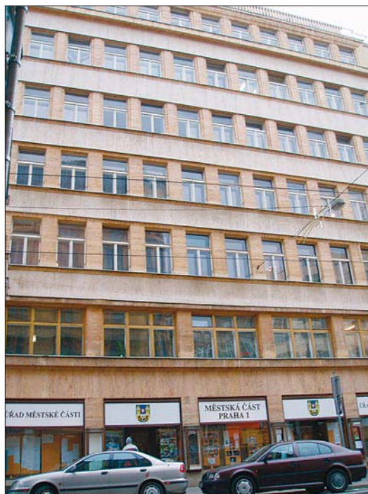
Komplexní audit má zjistit a přesně pojmenovat rezervy ve fungování radnice.

Firma, která komplexní audit provede, samozřejmě vzejde z výběrového řízení. „Nechceme s touto zále-