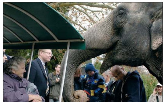
... kde na ně čekalo mnoho zajímavých zážitků.

a zdravotnictví Úřadu MČ Praha 1. 2. Dochází ke změnám ve výši úhrad za jednotlivé úkony pečovatelské služby. Zákon určuje maximální ceny, Rada MČ Praha 1 stanoví na základě doporučení sociální komise ceny, které bude účtovat středisko sociálních služeb příjemcům těchto služeb z Prahy 1. Středisko sociálních služeb bude i nadále poskytovat pečovatelské služby, a to jak v bytech obyvatel Prahy 1, tak i ve všech čtyřech domech s pečovatelskou službou, které provozuje na území Prahy 1. Uzavírání smluv o poskytování pečovatelské služby bude probíhat po dohodě s okresovými sestrami, které je možno kontaktovat na těchto telefonních číslech: Hana Hautnerová, Dlouhá 23, tel.: 222 322 201 Miroslava Bedřichová, Pštrossova 18, tel.: 224 932 237 Marie Vilímová, Týnská 17, tel.: 224 827 102