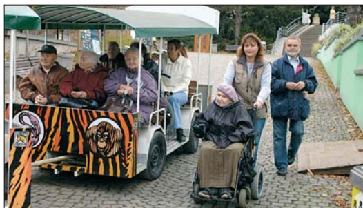
28. listopadu MČ Praha 1 zorganizovala pro své seniory návštěvu v pražské zoologické zahradě...

Středisko sociálních služeb, Dlouhá 23, Praha 1 oznamuje: Od 1. ledna 2007 nabývá účinnosti nový zákon o sociálních službách č. 108/2006 Sb. V souladu s tímto zákonem dochází mimo jiné k následujícím změnám: