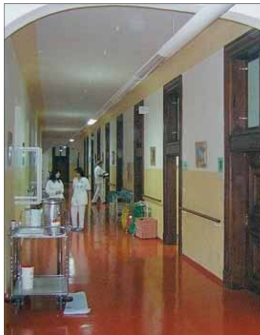
Rozpočet pamatuje tradičně na modernizaci Nemocnice Na Františku.

„Rozpočet je podle mého názoru vyvážený a také uvnitř jednotlivých kapitol správně sestavený. S přihlédnutím ke všem klíčovým potřebám městské části mohou konstatovat, že