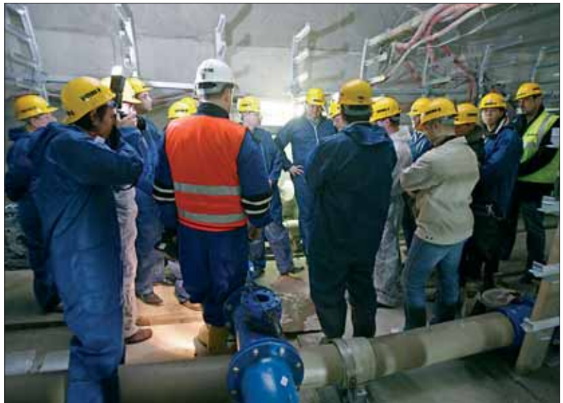
Kolektor je veden v hloubce 13 až 17 metrů pod zemských povrchem.

Z technického pohledu lze kolektory rozdělit do tří základních kategorií. Kolektory I. kategorie – transverzální neboli takzvané napájecí. Tyto kolektory mají celostátní nebo celoměstský význam, avšak zde se nevyskytují. Kolektory II. kategorie – hlavní neboli zásobovací. Tyto kolektory jsou vedeny v hloubce okolo 30 metrů pod povrchem a jsou v nich uloženy silové kabely 22 kV a 4,4 kV, sdělovací kabely městské telefonní sítě, potrubní pošta, plynová a vodovodní potrubí menších profilů.