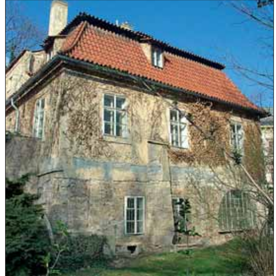
Lidé se nemusí obávat, že by se ve Werichově vile uhnížil nevkuš.

Radnice si hodlá podržet určitou kontrolu nad objektem Werichovy vily i po podepsání nájemní smlouvy s budoucím nájemcem. „Součástí nájemní smlouvy bude samozřejmě také ustanovení, které umožní pravidelné i namátkové kontroly, zdali jsou dodržovány všechny smluvené podmínky včetně způsobu využití budovy,“ podotkl zástupce starosty. Veřejná soutěž na využití Werichovy vily se konala již předloni. Soutěž však posléze musela být zrušena kvůli změně zákona během příprav soutěže. Radnice nechala v minulosti Werichovu vilu zčásti opravit s tím, že úpravy interiéru provede právě nový nájemce objektu. Součástí úprav byly i záahy do zeleně, kdy zůstaly zachovány hodnotné vzrostlé stromy a naopak byly odstraněny náletové, ovocné a druhově nevhodné dřeviny. Werichova vila – jeden z nejznámějších pražských domů – bývala na počátku 17. století koželuznou. Poté zde postupně žili národní buditel Josef Dobrovský, básník Vladimír Holan a posléze Jan Werich se svou rodinou (1945 až 1980). Od roku 1985 zde bydlela Anna Havránková-Slavíčková (z rodu malíře Antonína Slavíčka). Do vily se ale po povodních v srpnu 2002 již nevrátila.