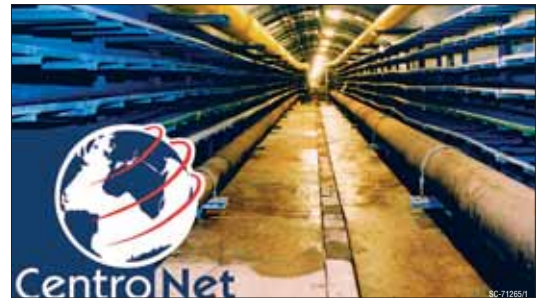
Pohled do hlubin kolektorů, ve kterých jsou uloženy optické sítě.

Pro naše klienty je určitě velmi příjemné, že za tuto službu neplatí žádný