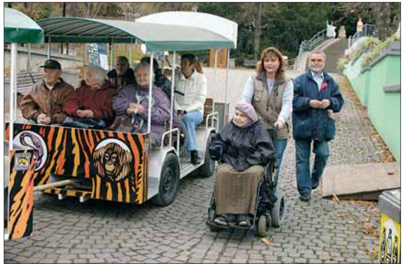
Péče o seniory v Praze 1 má mnoho podob. Kromě přímé sociální výpomoci je důležitá také pestrá nabídka společných aktivit.

Velkým úkolem je modernizace Nemocnice Na Františku. Co nové