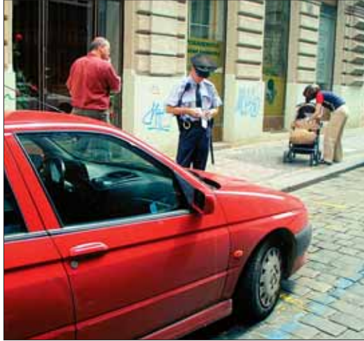
Počet dopravních přestupků v Praze 1 narůstá...

Zvýšení počtu strážníků v ulicích patří mezi programové priority nově zvolené Rady MČ Praha 1. „Kromě