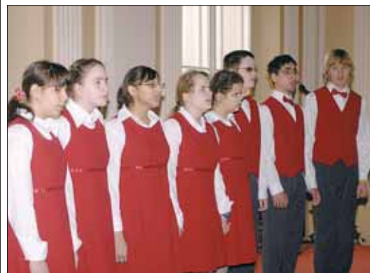
Křest knihy a CD Šťastné blues aneb Z deníku Jaroslava Ježka doprovodily svým vystoupením děti ze sboru Školy Jaroslava Ježka, z Konzervatoře Jana Deyla a ze Střední školy pro zrakově postižené.

Praha tajemná nabídla místa, kterými procházela historie, opředěná tajemstvím a legendami – muzea a další pamětihodnosti, včetně jinak nepří-