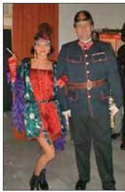
Odhalování vlnad porušuje vyhlášku...