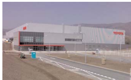
Skladovací hala v Krupce.

V naší nabídce je zpracování územních, urbanistických a architektonických studií, ale i studií dopadu na životní prostředí (EIA) či hlukových a rozptylových studií. Naši další, neméně důležitou činností, je vypracování projektové dokumentace pro územní řízení a stavební povolení a projektové dokumentace pro výběr dodavatele a pro realizaci. Pro klienty dále zajišťujeme počítačové modely projektů a staveb včetně jejich vizualizace a fotomontáže. Velmi žádanou službou je