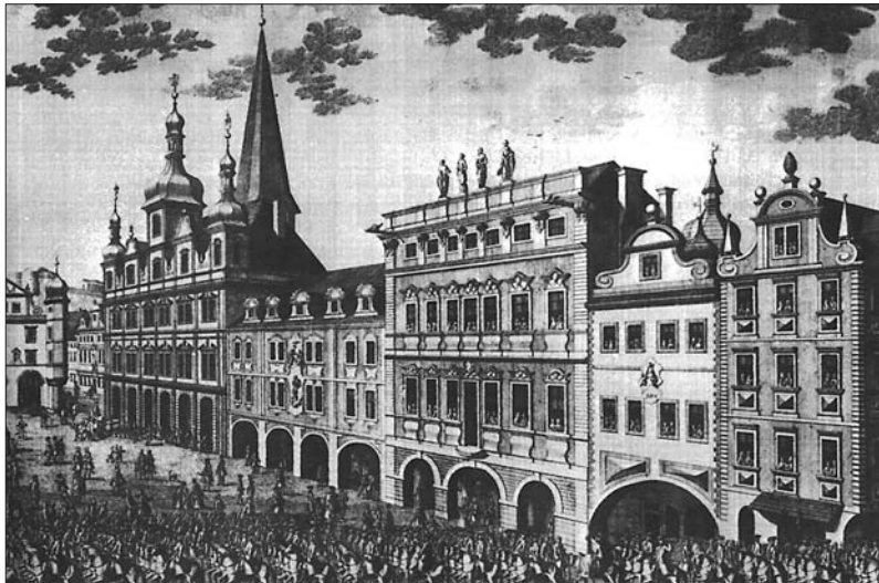
Na obrázku z roku 1743 Malostranskou besedu ještě krášlily věžičky ...

Společenské a kulturní centrum pro všechny generace – proti minulosti však s moderním zázemím – vznikne v Malostranské besedě, kde v současné době probíhá kompletní rekonstrukce všech prostor. Přidanou hodnotou projektu je návrat historických věžiček na střechu budovy po dvou stoletích.