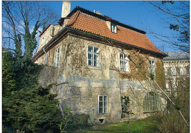
Výběrové řízení na Werichovu vilu probíhá již podle nových, transparentnějších pravidel.