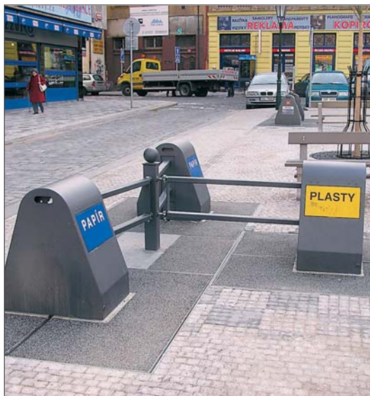
... podzemní vkusně zapadají do koloritu města.

Městská část Praha 1 nechala ve zkušebním provozu instalovat podzemní kontejnery na tříděný odpad (pod Petřským náměstím). „Uvažujeme o rozšíření tohoto moderního prvku. Podzemní kontejner je vkusný, nezabírá místo a nehromadí se kolem něj odpady,“ uvedl starosta MČ Praha 1 Petr Hejma.