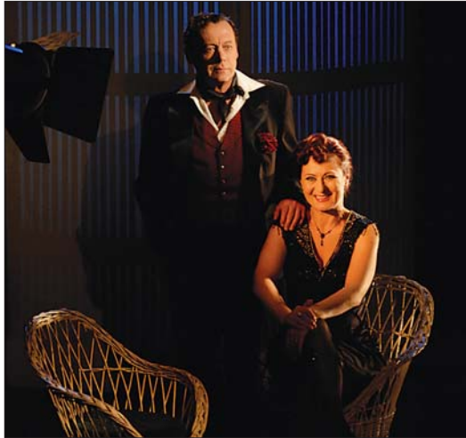
Příběh je poutavý a současně dojemný.