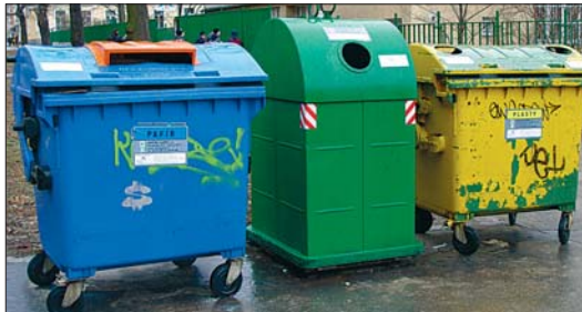
Zatímco klasické kontejnery působí často nevzhledně...

Tato norma vysvětluje základní pojmy, charakterizuje druhy komunálního odpadu a jeho třídění, určuje místa pro odkládání komunálního odpadu a stanovuje povinnosti fyzických osob a vlastníků objektů při nakládání s komunálním odpadem. Obsahuje také ustanovení o frekvenci svozu odpadu a o způsobu využití či odstraňování odpadu. Součástí vyhlášky o odpadech je klasifikace a množství stavebního odpadu, který mohou občané bezplatně odevzdávat do sběrných dvorů města. Toto množství nelze kumulovat.