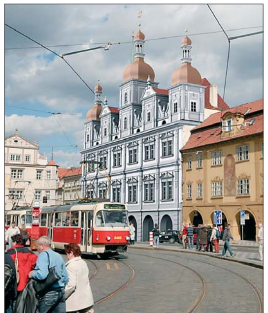
...a na aktuální vizualizaci jsou po staletích zpátky!

CHCEME ZNÁT I VÁŠ NÁZOR NA VYUŽITÍ MALOSTRANSKÉ BESEDY. NENECHTE SI JEJ PRO SEBE, PÍŠTE NÁM NA ADRESU VNEŠJIVTAHY@PRAHA1.CZ!