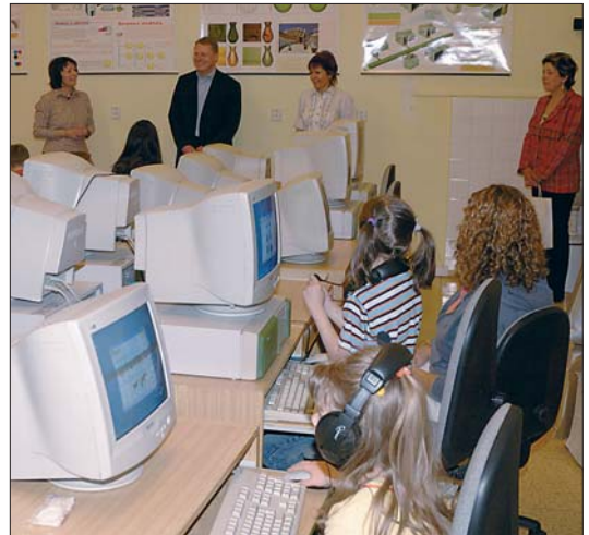
V ZŠ na náměstí Curieových mají zelenou moderní metody výuky.

Škola nabízí v rámci programu protidrogové prevence velké množství vol-