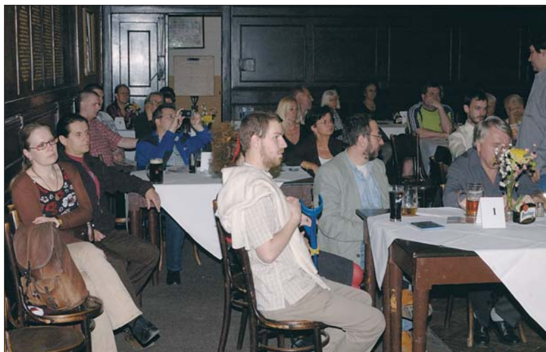
Setkání se zúčastnilo přes padesát občanů Prahy 1.