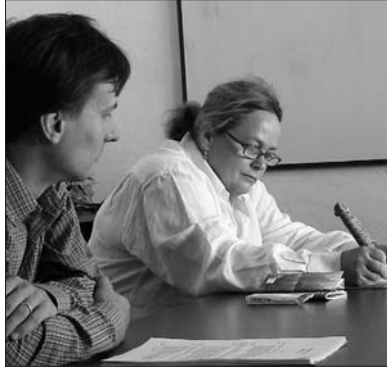
Momentka ze čtené zkoušky hry Zlomátka...

Velkou devízou Gelardiho hry je, že na společenské podněty reaguje aktuálně, že se odehrává teď a tady, což u divadelních her není právě běžné, protože často trvá řadu let, než