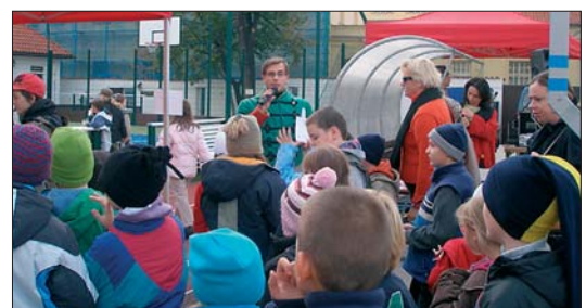
... a tak na hřišti brzy byla „hlava na hlavě“.

odměny. Akci pořádala Nadace Pražské děti, za pomoci Kometa, o. s. a zaměstnanců odboru strategického marketingu Skupiny ČEZ.