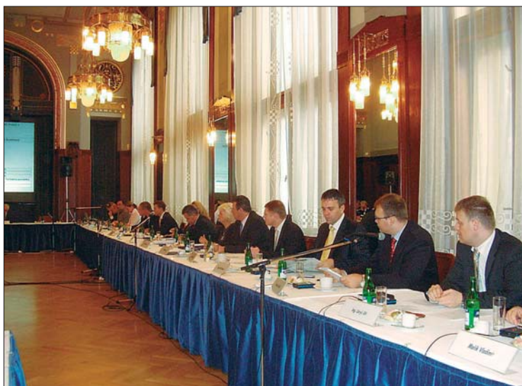
Nové vedení MČ Praha 1 chce přátelskou a otevřenou radnici.

První jednání nové Rady MČ Praha 1 se uskutečnilo po uzavření listu, v pondělí 27. listopadu.