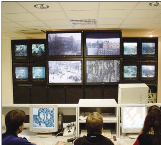
Kamerový systém funguje v nepřetržitém provozu.

Na území Městské části Praha 1 zatím police vyzývá 65 kamer. Systém se osvědčuje hlavně při sledování míst se zvýšeným výskytem pouliční kriminality. „V roce 1999 bylo na území MČ Praha 1 instalováno 16 kamer. V roce 2006 je to již 65 kamer, na které městská část přispěla z rozpočtu částkou více jak 9 milionů korun,“ řekl za radni-