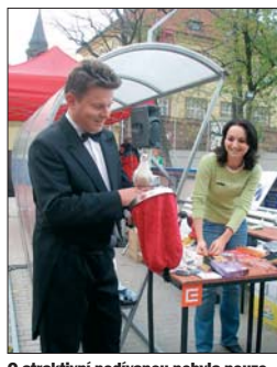
O atraktivní podivnou nebyla nouze...