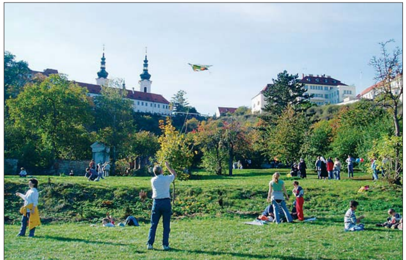
Při pouštění draků v nemocniční zahradě panovala doslova happeningová atmosféra.

Pouštěním draků a veselým happeningem ozila v neděli 22. října zahrada Nemocnice Milosrdných sester sv. Karla Boromejského, kde se konala „drakiáda“ pro širokou veřejnost.