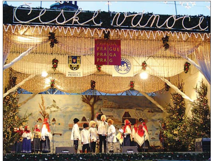
Vánoce – to jsou především tradice...

Netradiční Vánoce zajišťují letos děti z pěti dětských domovů a lidé z Centra zdravotně postižených. Ve středu 6. prosince bude oficiálně odstartován projekt, který nese název Charitativní bazar. Cílem tohoto projektu je shromáždit věcných darů, které budou přeroděny potřebným. „Většinou lidé přispívají na charitu penězi nebo nakupují hračky pro děti. My přicházíme s alternativou, která je hmatatelná. Rozdáváme vybraným institucím hygienické potřeby, oblečení a podobně,“ uvedla patronka projektu a vedoucí odboru strategické komunikace Skupiny