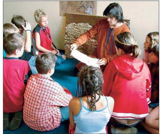
Tyto děti se nemusejí obávat, že by neuměly přemýšlet nad sebou i druhými.

V hodinách etické výchovy děti spontánně reflektují své reálné vztahy ve třídě i v rodině. Mají potřebu si o nich nejen povídat, ale také je řešit. Je to místo, kde se mohou plně koncentrovat na kultivaci svých postojů a komunikačních dovedností potřebných k hledání a nacházení řešení jejich vztahů. „Každý rok se setkáváme s nárůstem zájmu dětí o tento předmět. Příčinu vidíme nejen v kvalitě vedení lektorů, ale především ve vzrůstající potřebě osobního kontaktu a komunikace. Tím, že se hodiny účastní vždy děti jedné třídy, je výuka cílená a efektivní,“ dodává ředitelka školy.