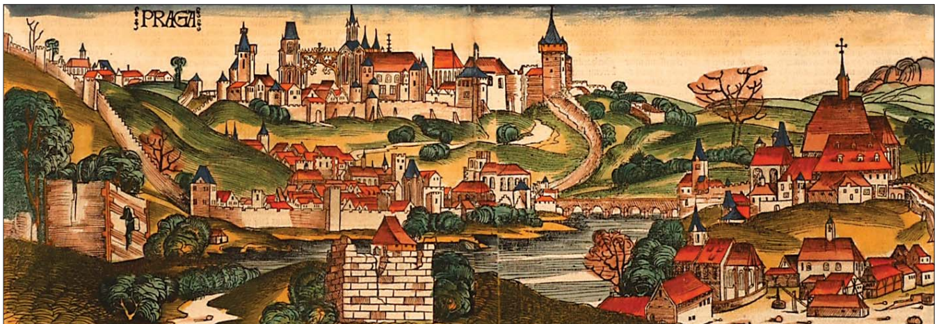
Panorama Prahy z roku 1493