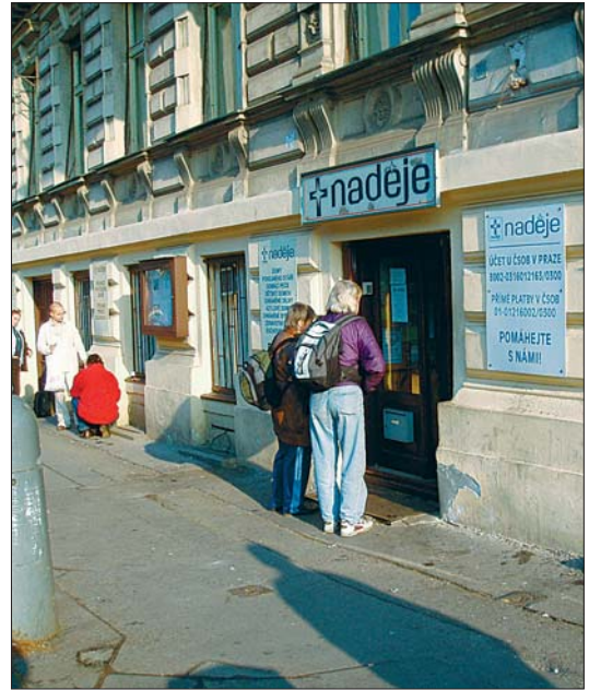
MČ Praha 1 samozřejmě spolupracuje i s nestátními organizacemi, které se zabývají problematikou bezdomovectví.

„Jeden z hlavních znaků bezdomovectví je koncentrace lidí bez příštěří v hlavních městech. Vzhledem k tomu, že jde o celosvětový problém, dá se říct, že každé velké město je postaveno před otázkou, jakým způsobem tento fenomén řešit. Praha 1 má to specifické, že se nachází v centru hlavního města, kde je navíc soustředěna většina křižovatek společenské i materiální infrastruktury,“ vysvětlil Č. Nekovavík.