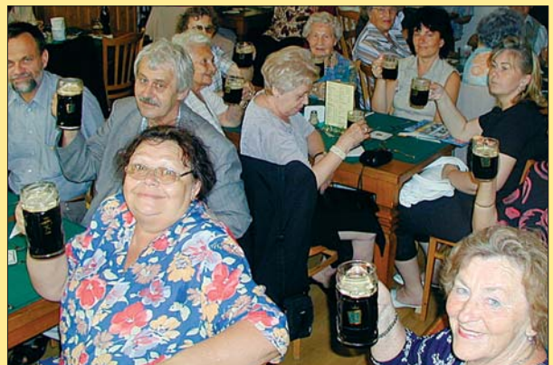
Organizování seniorských zájezdů a rekreací patří mezi významné aktivity MČ Praha 1. Nejen o oddech – díky vzájemným kontaktům vznikají i nová přátelství. Na snímku momentka z jednoho z nejpodařenějších zájezdů, loňské návštěvy seniorů z Bratislavy v MČ Praha 1.

Letáky jsou připraveny k nahlédnutí v Informačním centru v přízemí Úřadu městské části Praha 1, Vodíčkova 18, Praha 1.