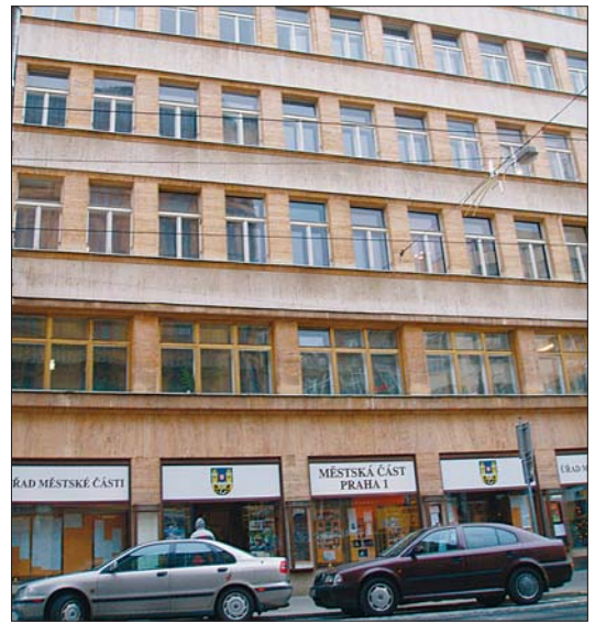
Radnice podle průzkumu občany dobře informuje.