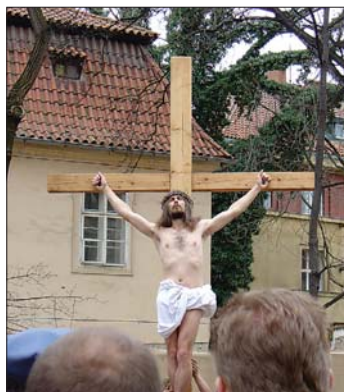
Velikonoce připomínají oběť Ježíše Krista.