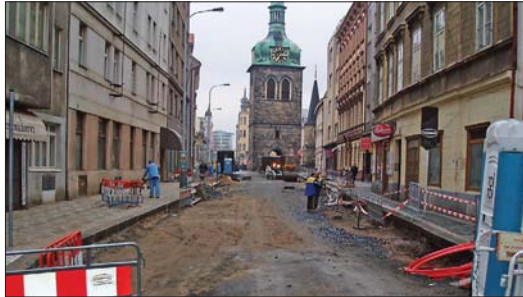
Obnova veřejných prostranství se týká i detailů – jako je tomu například v případě Petřské ulice a Petřského náměstí.

To rozhodně ne. Každý případ poškození je třeba posuzovat individuálně – klíčovými faktorem je samozřejmě rozsah poškození. Osobně se domnívám, že chodníky v některých