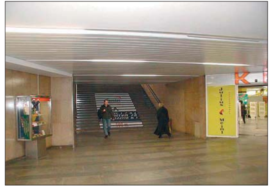
Uzavírání podchodů metra na noc je pro MČ Praha 1 veřejným zájmem.

V naší městské části máme poměrně dost gymnázií a středních škol a fakt je, že když restauraci navštíví dvacetiletí společně se šestnáctiletými, tak alkohol dostanou všichni. Bohužel ale máme zkušenosti i s dvanáctiletými opilci. Městská část Praha 1 podporuje detoxi-