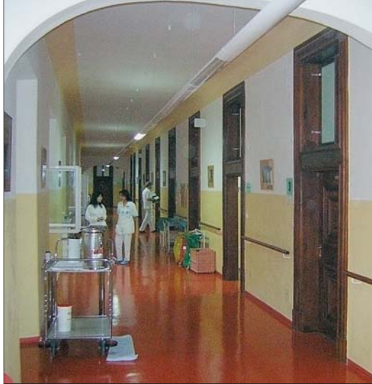
Nemocnice Na Františku se díky péči zřizovatele – Městské části Praha 1 – změnila ve vysoce kvalitní zdravotnické zařízení. Zákon o veřejných neziskových nemocnicích, který schválil 23. května levicoví poslanci přehlasováním prezidentského veta, jí může fakticky zlikvidovat.

Přílohou projednávaného návrhu novely zákona je seznam zdravotnických zařízení, která by se měla stát