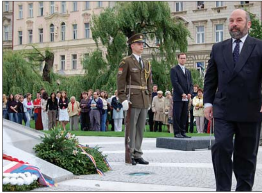
Slavnostní akt se odehrál v důstojné atmosféře.

Velký dluh odbojářům, kteří se nesmířili s nacistickou okupací, byl splacen 25. května na Klárově, kde došlo k odhalení pomníku II. odboji. Pomník bude trvale připomínat aktivní odpor vlastenců.