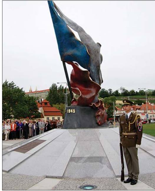
Pomník je vkusný a nadčasový.