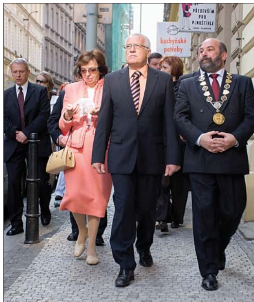
Prezident absolvoval část návštěvy pěšky, pozdravován kolemjdoucími.

Poté se manželé Klausovi v dopro- vodu představitelů Prahy 1 svezli historickou tramvají z Vodičkovy