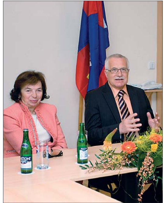
Prezidentský pár navštívil také Úřad MČ Praha 1.

Těsně před rozloučením shrnul prezident Klaus své dojmy z návštěvy centrální části hlavního města těmito slovy: „Jsem velmi rád, že se návštěva konečně uskutečnila. Dlouho jsme ji připravovali. Jakkoli člověk Prahu 1 zná, viděl jsem ji z jiného úhlu a z jiné perspektivy. Viděl jsem najednou úplně jiná místa, o kterých jsem netušil, že existují. Kdybych vzal jen dětské sportovní hřiště Na Františku, byl to mimořádný zážitek. Mám z toho moc dobrý pocit a jen mě to utvrzuje v tom, že mám tyto návštěvy konat i nadále.“