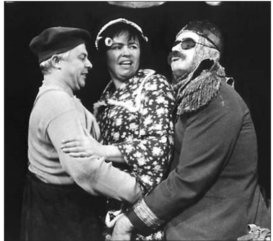
Král Ubu se hrál v Divadle v Řeznické tři roky.